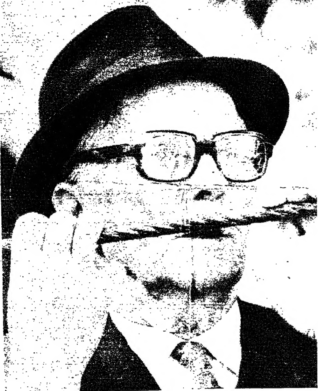
■ تاريخ البرتغال رسوم في قسرات وجهه